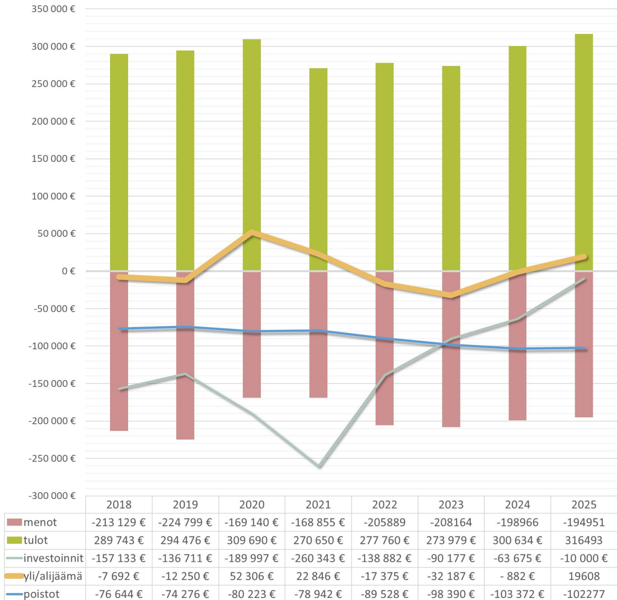
Vesilaitoksen talous 2018-2025